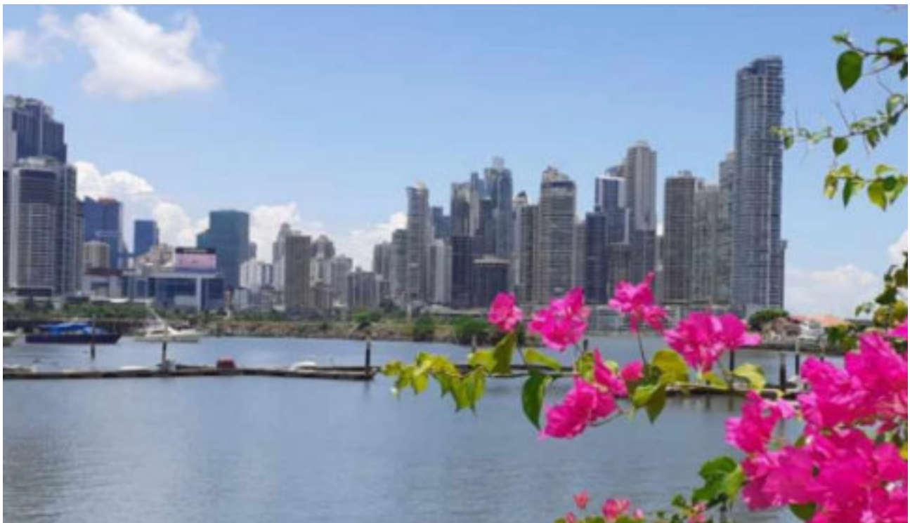
Blick von der kolonialen Altstadt hinüber zu dem modernen Part von Panama-City

Das Gepäck (p.P. 23 kg) checken Sie bitte nach Panama City durch. Transatlantikflug ab Frankfurt/Main via Amsterdam. Ankunft Ortszeit Panama-City um 16:25 Uhr. Transfer mit lokalem, englisch- oder deutschsprachigem Guide zum „Basishotel“ Paitilla im modernen Part von Panama-City. Zimmerbezug, abends kurze Besprechung bei einem leckeren, kalten Corona-Bier. Übernachtung in DZ im Basishotel Paitilla in Panama-City. Mahlzeiten im Flugzeug