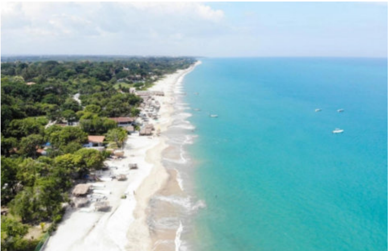
Naturstrände am Pazifik, Panama

Hinweis: Panama ist im Aufbruch, was den internationalen Tourismus angeht. Dieses mittelamerikanische Land hat eine außerordentlich reizvolle Natur. Bei dem Hotelstandard darf man nicht mit "Sterne"-Kategorien in Europa vergleichen. Die traumhafte Ursprünglichkeit in Panama wird unvergesslich bleiben!