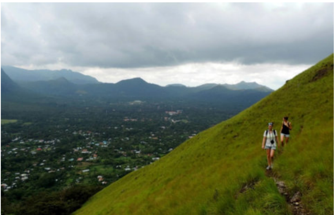
Valle de Anton, Panama

Durch das im Valle de Anton vorherrschende Mikroklima, hat sich in dieser Gegend eine einzigartige Flora und Fauna angesiedelt, wodurch es sehr reizvoll ist diese Region Panamas ausgiebig zu erkunden. Eine der Top Sehenswürdigkeiten in Panama mit tollen Highlights!