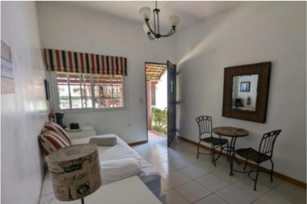
Zimmerbeispiel Villa Botero

Auf dieser traumhaften Tour erfolgt an der Pazifikküste 1 Ü/F im urigen, kleinen Hotel Villa Botero by Casa Mojito an der Pazifikküste von Panama. Ein wunderbarer Tag zum relaxen an den Naturständen.